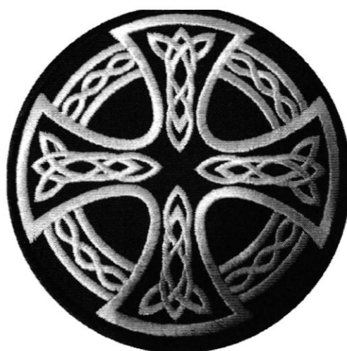
Рисунок 2. Кельтский крест. Символ многих расистских организаций